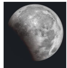
部分月食ピーク時のイメージ

◆ 太陽・地球・月が一直線上になった時に見られる現象 です。月が地球の影に入ることによって満月の月が欠けて見えたり、真っ赤に染まることがあります。 今回は月の一部が地球の影に隠される「部分月食」が起こります。 早朝と少し眠たい時間ですが、布団を飛び出して観察してみましょう♪