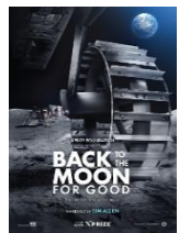
NSC PRODUCED BY creative

少年時代、二人で宇宙へ行こうと約束した弟・日々人と兄・六太。十数年後、夢を叶えた日々人が宇宙飛行士として脚光を浴びる一方、六太はまさかの無職となっていた。そんな中、夢を誓った高台に、UFOを探しに通っていた二人は、一人の少女と出会った。やがて明らかになる少女の「願い」を叶えることができるのか!?