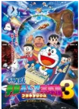
©Fujiko-Pro,Shogakukan,TV-Asahi,Shin-ei, and ADK ©JAXA 提供 Courtesy NASA/JPL-Caltech.