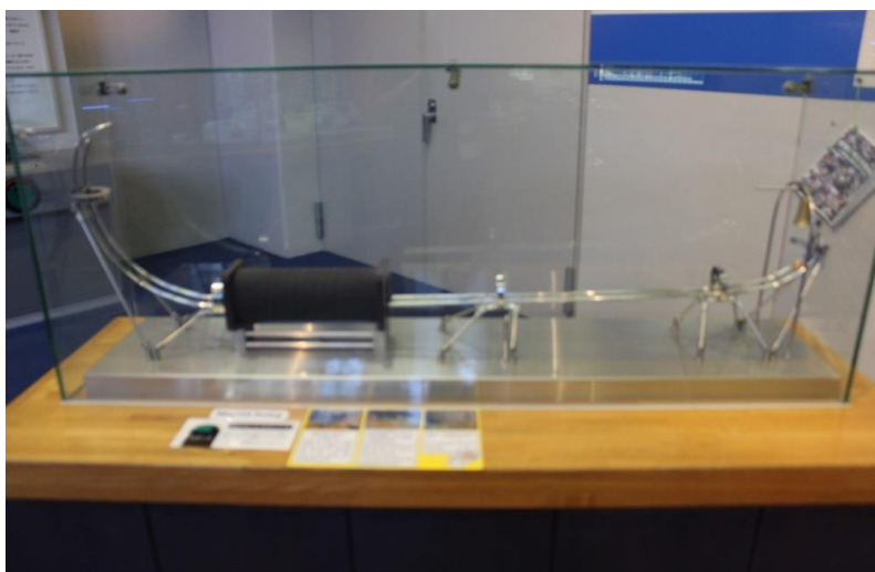
【マグネット・スウィング 全体像】