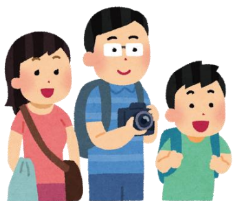
非会員 会員 会員 (保護者カード：無料)

大人会員であるお父さんが「保護者カード」を作れば、それを使ってお母さんも無料でご入館できます。お父さんが不在の場合もお母さんとお子さんでご入館できます。