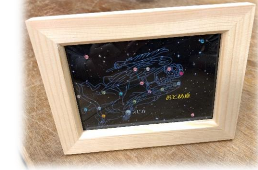
工作：「キラキラ星座カード」づくり ※写真はイメージです。

前半に「キラキラ星座カードづくり」を行い、後半は1等星カノープスや南半球の星空などについてご紹介します。その後、屋外で天体観望会を行います。