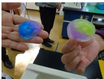
アンモナイトの キーホルダー