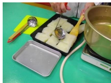
こんにゃくづくり