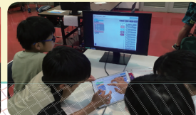
プログラミング学習