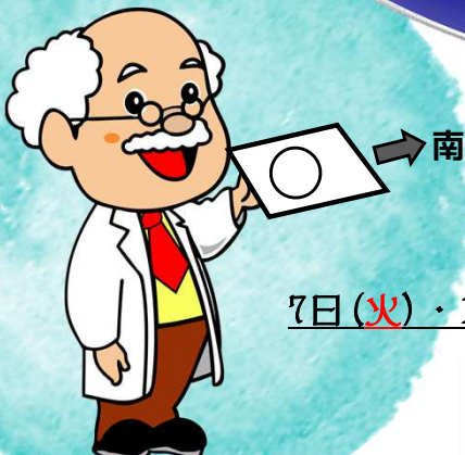
宮崎科学技術館マスコットキャラクター コスモ博士

南の空を向き、 この図をそのまま 頭の上にかざすと、 星座早見盤の 代わりになるぞ♪